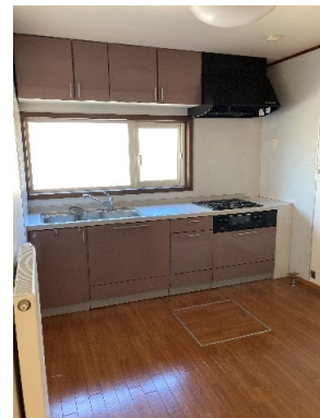
キッチン現況写真