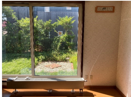
リビング現況写真