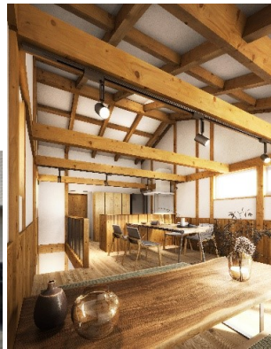
内部イメージパース